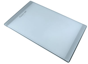
Tagliere in cristallo