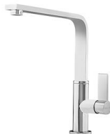
Miscelatore NYC 8486 000