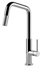
Miscelatore KS Plus 8522 000