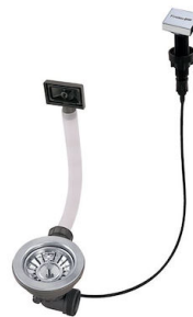
Piletta automatica LIRA 8407 102