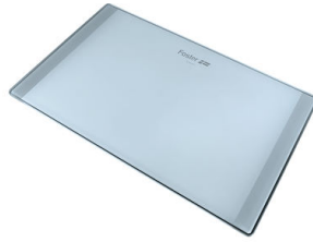
Tagliere in cristallo

* solo in abbinamento con l'accessorio 8644 101