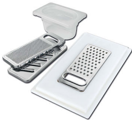
Kit grattugia con supporto per anello e vassoio di raccolta alimenti