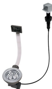
Piletta automatica LIRA 8407 103